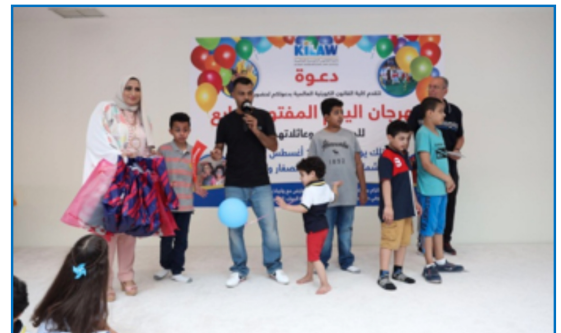
فرحة ابناء الموظفين في اليوم المفتوح

The event included a series of activities and events for adults and children, such as competitions, henna and tug-of-war, in which everyone competed in order to win prizes that were allocated for this occasion, thus creating an atmosphere of joy for the audience who exchanged friendly conversations throughout the hours of this day, while children were not tired of playing games and having fun.