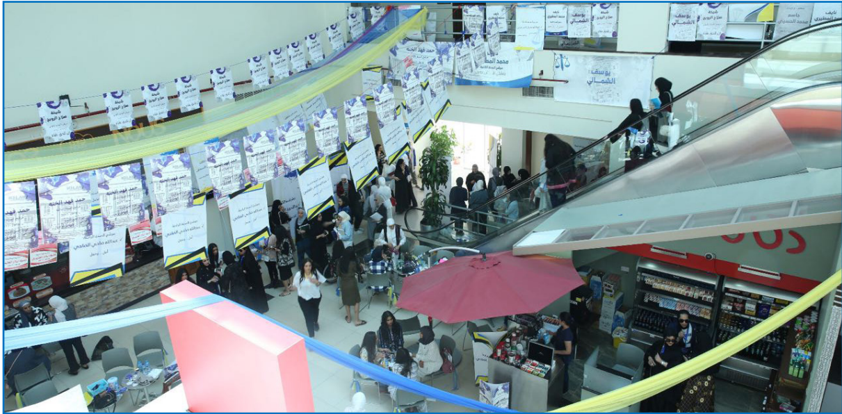
Candidates' posters during Students Elections