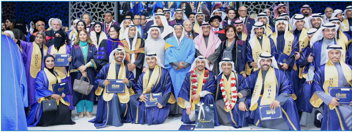
A Photo Reflecting the Graduation' Joy

من جانبه، أعرب رئيس وعميد الكلية د. المقاطع عن سعادته بتخريج الدفعة الثالثة من الطلبة لينطلقوا في ركب الحياة المهنية مزودين بكل ما يحتاجون إليه ليحققوا لأنفسهم غداً مشرقاً مفعماً بالعطاء لوطنهم ومجتمعهم وهم يكملون مسيرة من سبقهم. وقال ان الكلية تفخر بخريجيتها وهم نتاج تخطيط وتنفيذ مميز، مشيراً إلى ان هذه الكوكبة هم نتاج منهج علمي أكاديمي ثنائي اللغة وضع بعناية وفق أعلى المعايير العلمية العالمية.