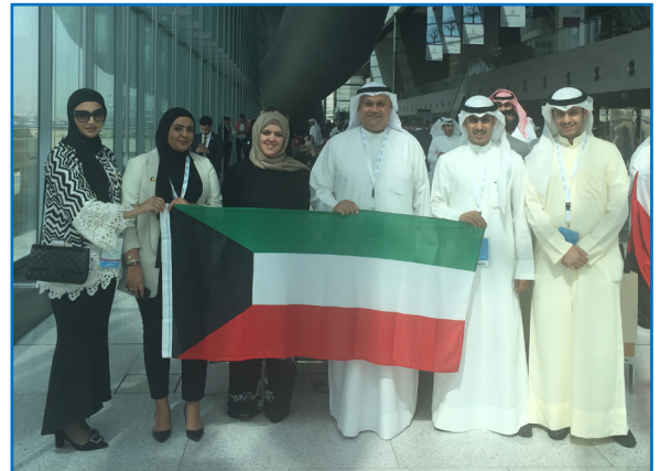
Qatar Debates Team