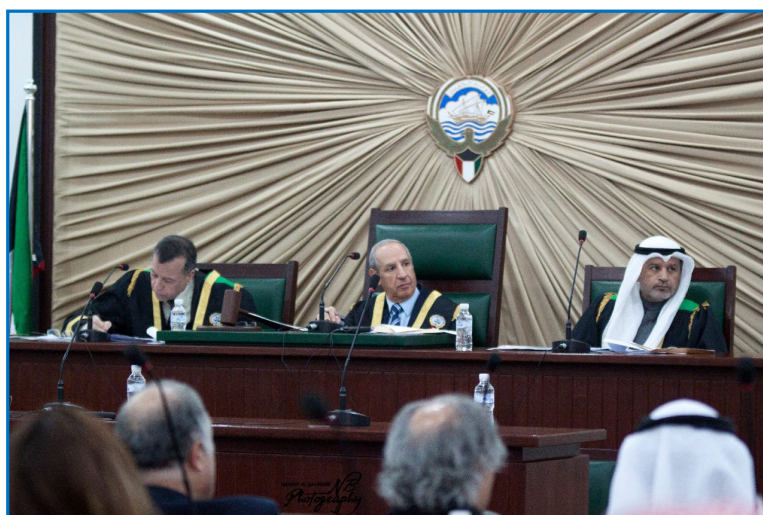
Arabic Moot Court Judges