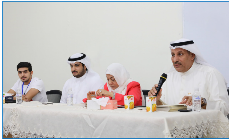
Participants in the Orientation Day

و في نهاية اللقاء تم دعوة الجميع لاستلام المطبوعات والهدايا: ثم دعوتهم ليوفيه الضيافة.