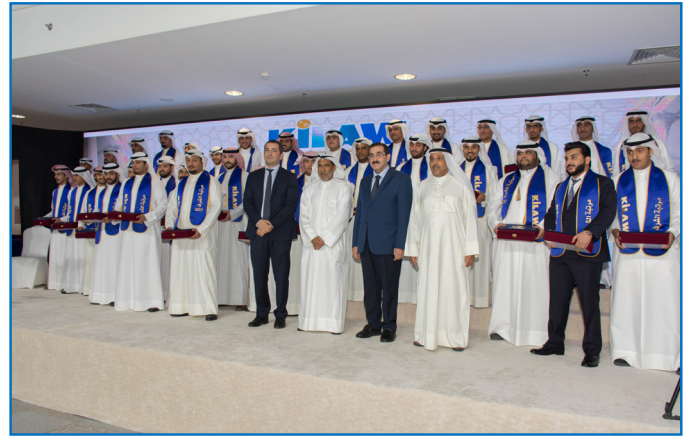
مجموعة من المكرمين مع عميد الكلية وعدد من الأساتذة A group of honored Students with the Dean and a number of professors