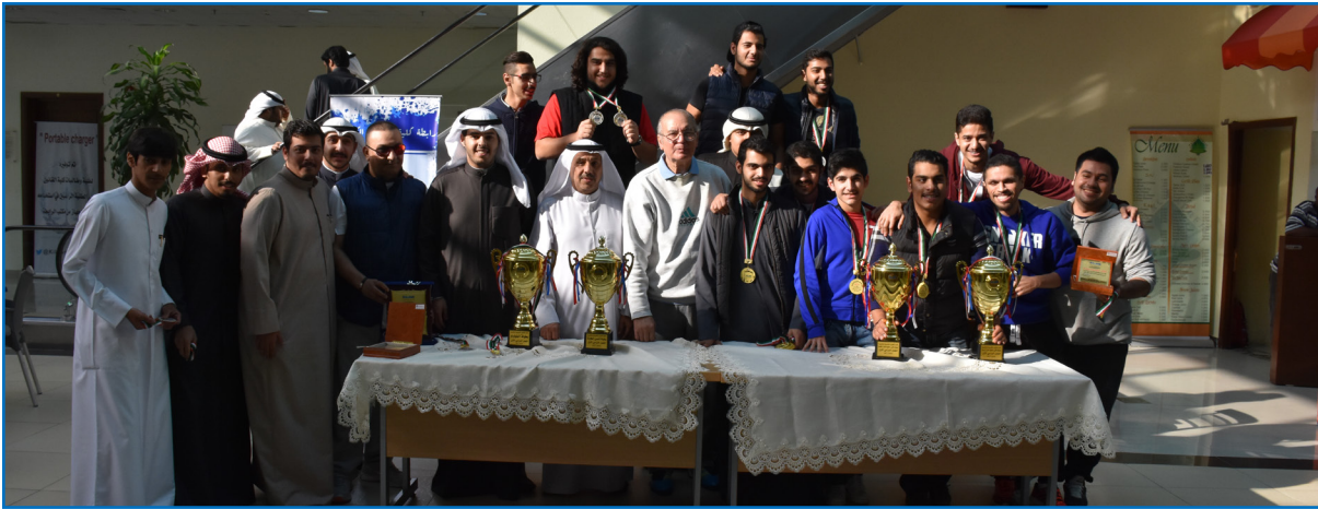
Honoring the winners in Sport Competitions