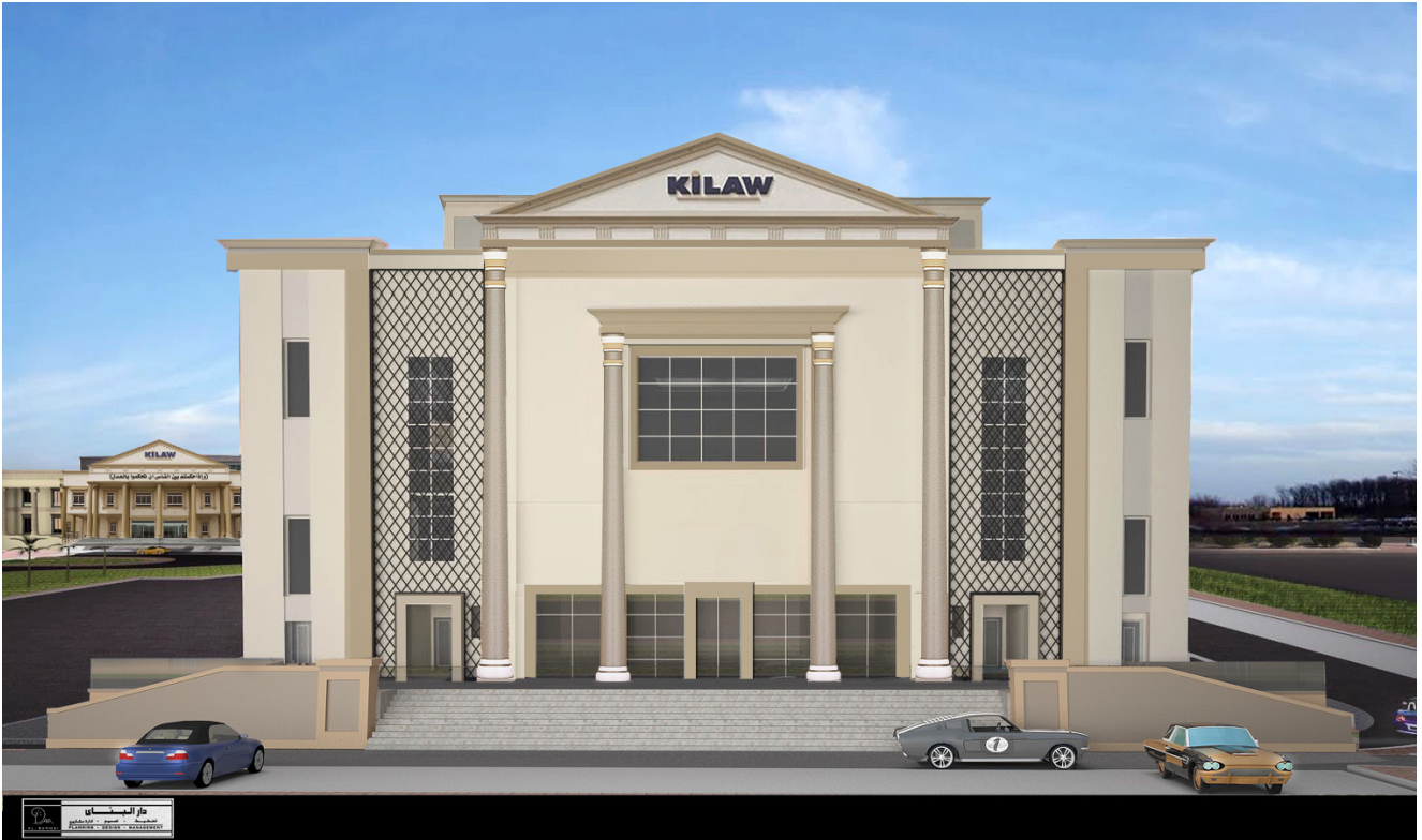
واجهة المبنى الجديد المتعدد الخدمات

فإن الحلم يتم استكمالته قريباً، بالانطلاق نحو آفاق أوسع تخدم العقل والجسم، تنفيذاً للمقولة الشهيرة «العقل السليم بالجسم السليم». حيث ستبدأ ورشة بناء صرح معماري من دورين وسرداب فسيح مكمل لصرح الكلية، في مبنى جديد متعدد الخدمات، يتضمن مكتبة للأبحاث والدراسات، ومسرحاً متعدد الاستخدامات مجهزاً بأحدث المعدات والوسائل السمعية والبصرية، وصالات ألعاب لكرة اليد والجمنازيوم، ومسبجاً أولمبيا، وصالات للمطاعم والمقاهي الحديثة ومواقف فسيحة للسيارات.