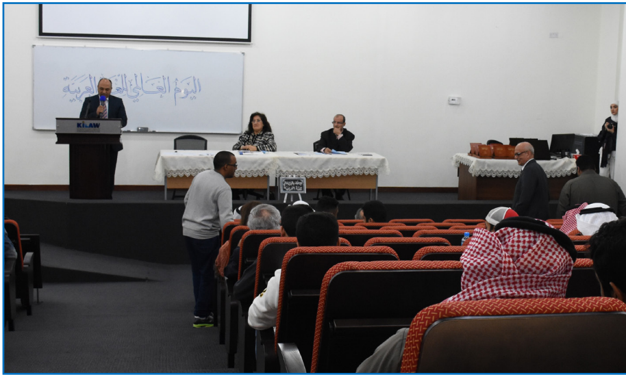
Participants in the Celebration