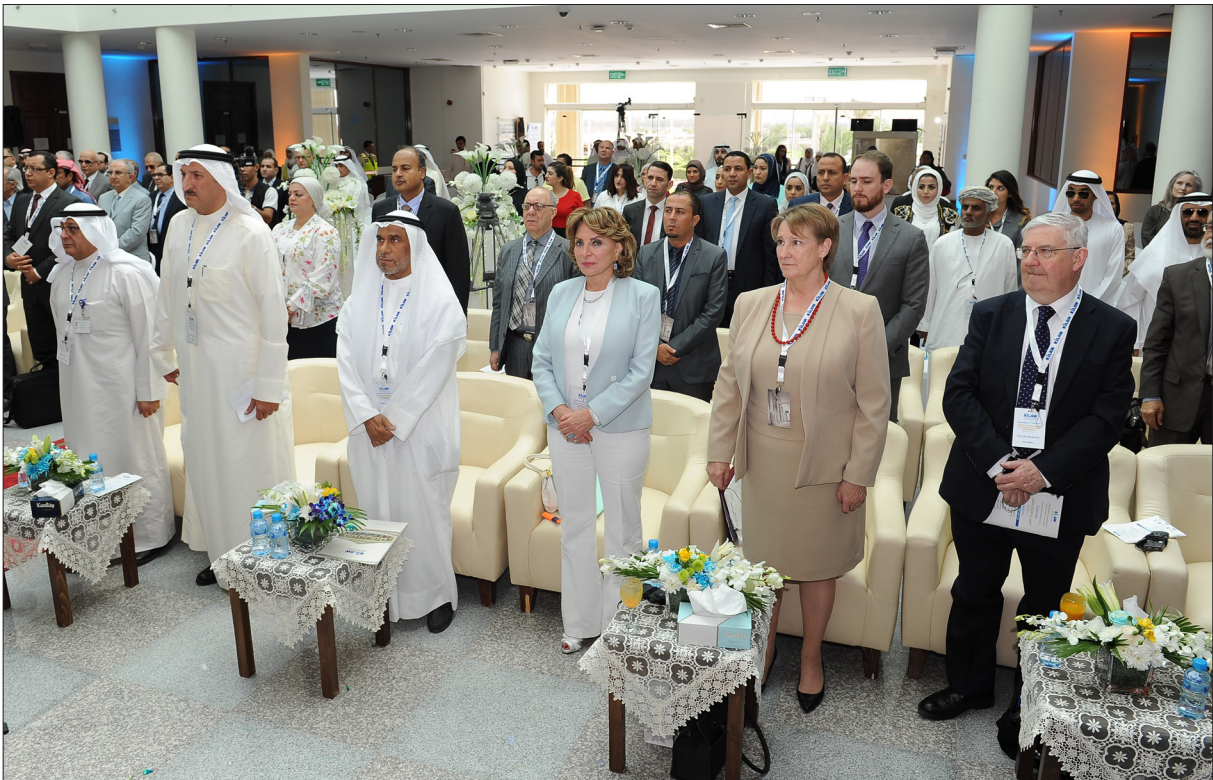
الوقوف خبة للنشيد الوطني في افتتاح المؤتمر الرابع

وقد توالى فعاليات المؤتمر التي تضمنت (11) جلسة نقاشية على مدى يومين من بينها جلسة خاصة لبحوث طلبة الكلية تشجيعا لهم على البحث وإعداد الدراسات حول القضايا القانونية العامة.