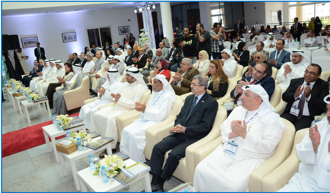
The Opening of the Arabic Moot Court