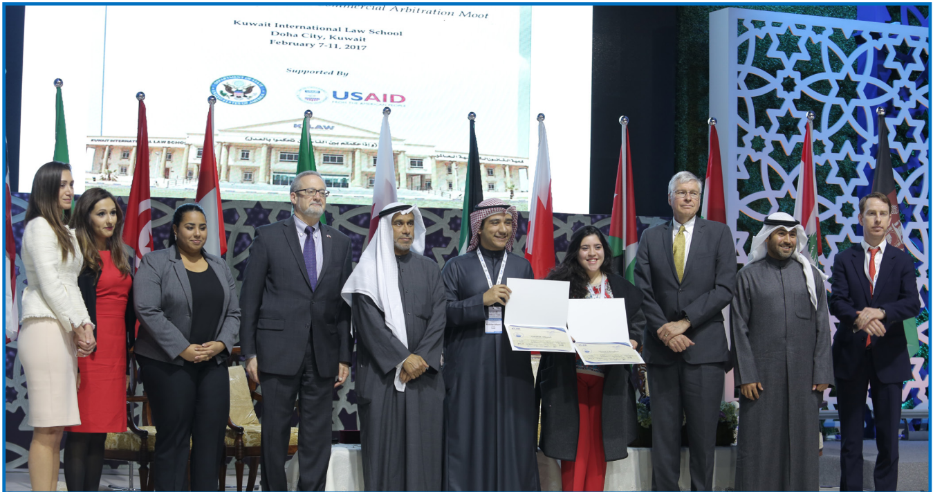
The School,s Dean and th Ammbassador among the participants المسابقة في المشاركين من المشاركين في المسابقة