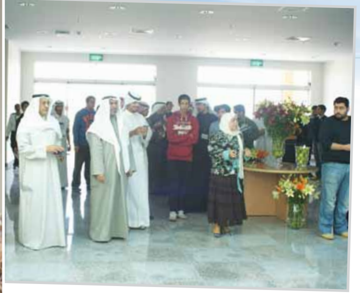
معرض ويوم مفتوح بعنوان بيتتي مسئوليتي