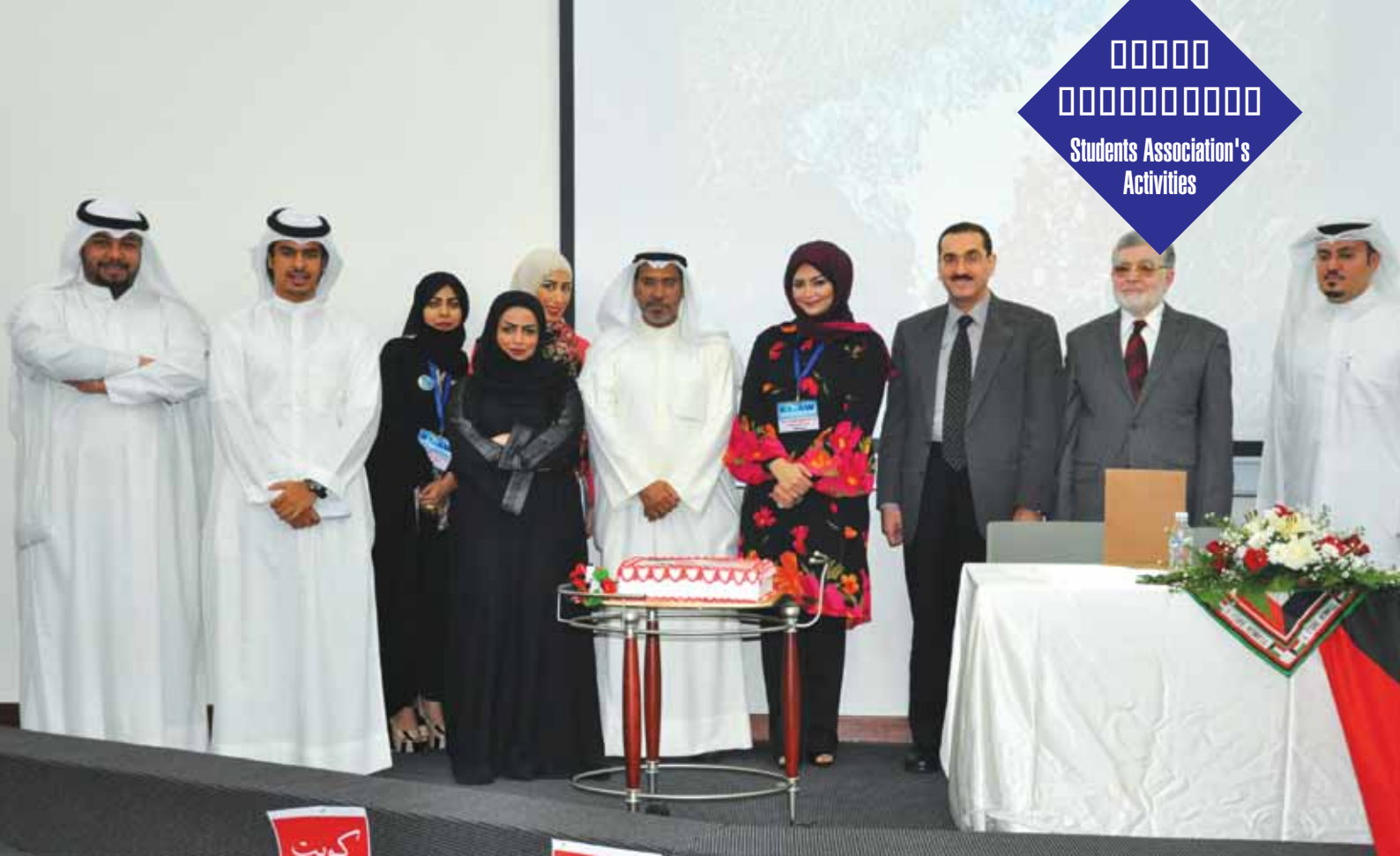
صورة تذكارية مع فريق العمل في احتفالية بمناسبة مرور 50 عاماً على صدور الدستور الكويتي