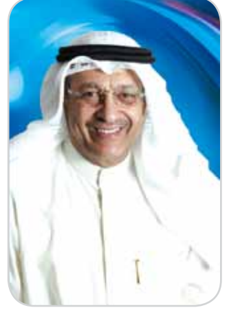
كلمة رئيس مجلس الأفناء الدكتور/ بدر خالد الخليفة