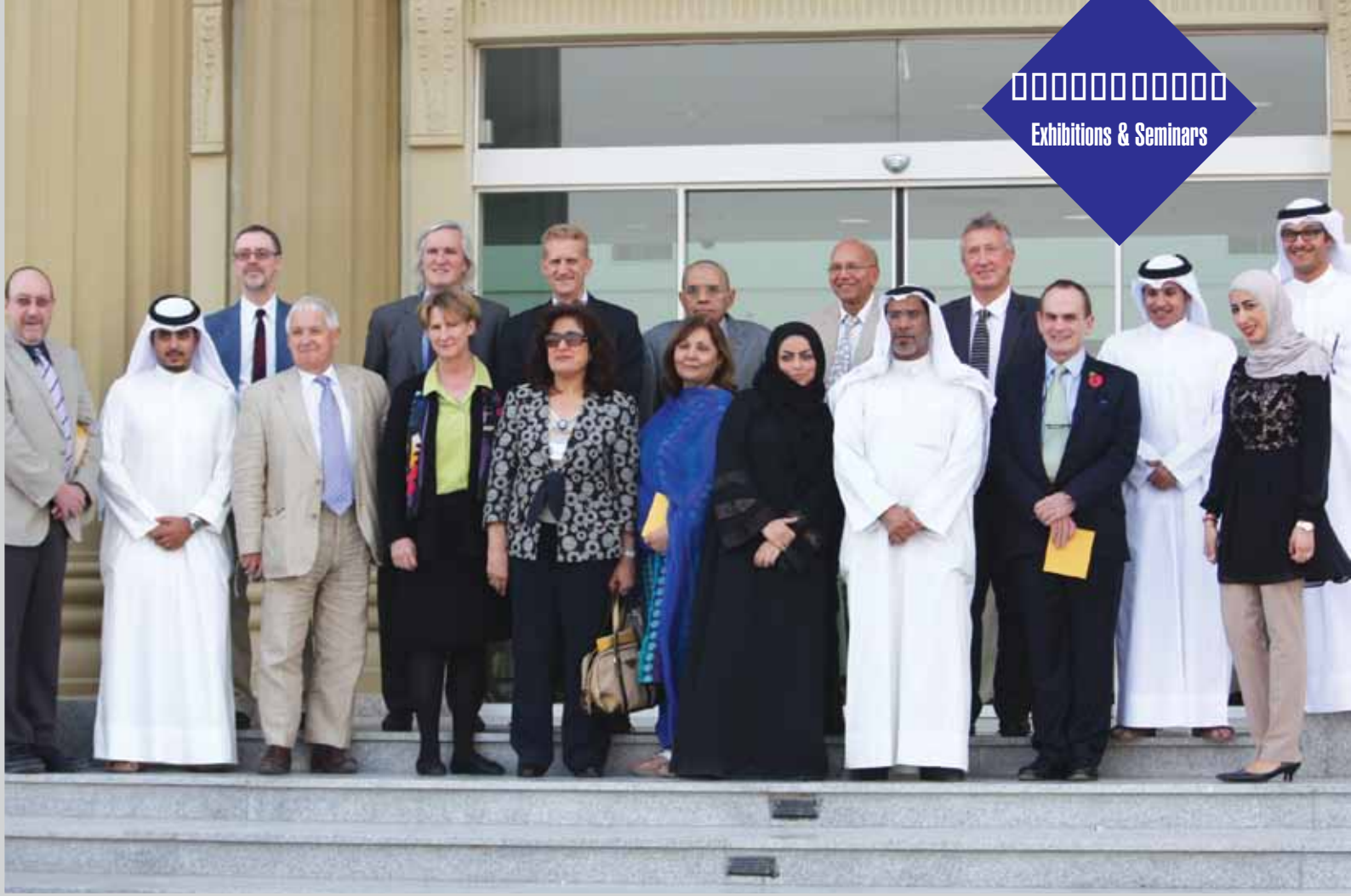
زيارة وفد الجامعات الزميلة والمجلس الإستشاري أثناء تقييم الكلية