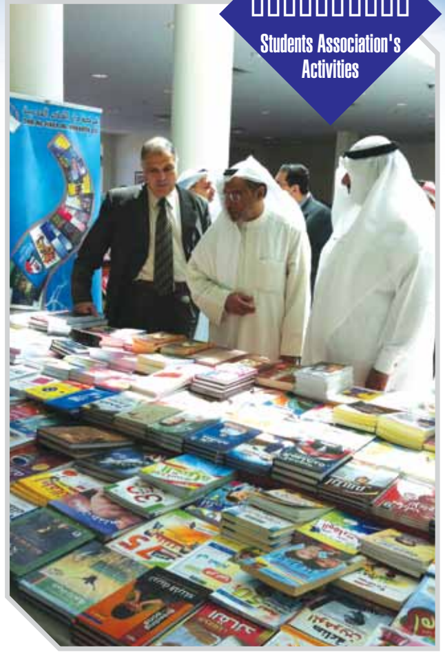
جولة في معرض الكتاب