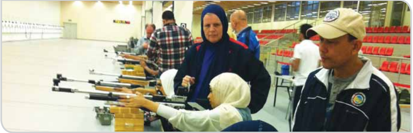
استخدام السلاح تحت اشراف مدربين متخصصين في نادي الرماية