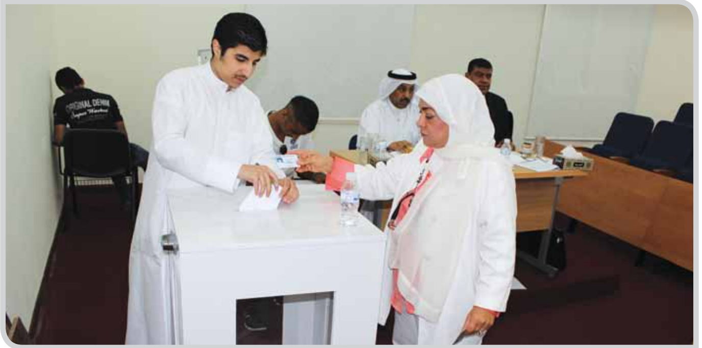
طالب يدلي بصوته في لجنة الطلبة