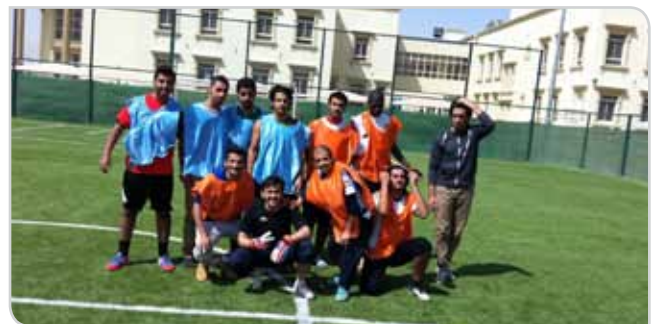
دوري كرة القدم