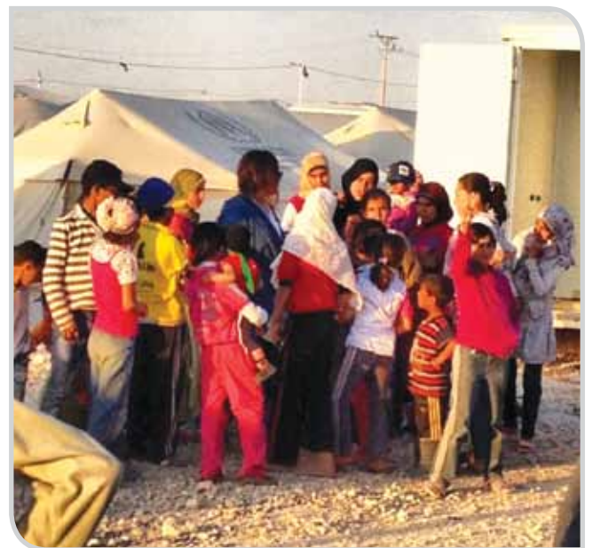
مخيم الزعتري للاجئين السوريين في الأردن