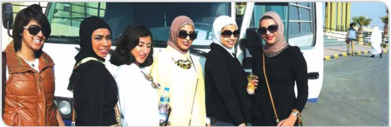
قبل الانطلاق إلى المحكمة الدستورية