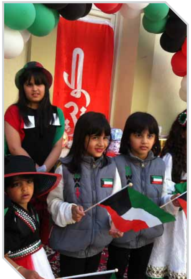
الأطفال يشاركون في الاحتفالات الوطنية