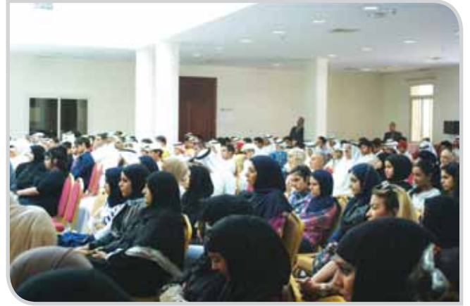
جانبا من حضور الطلبة مع أولياء الأمور في أحد اللقاءات التنويرية