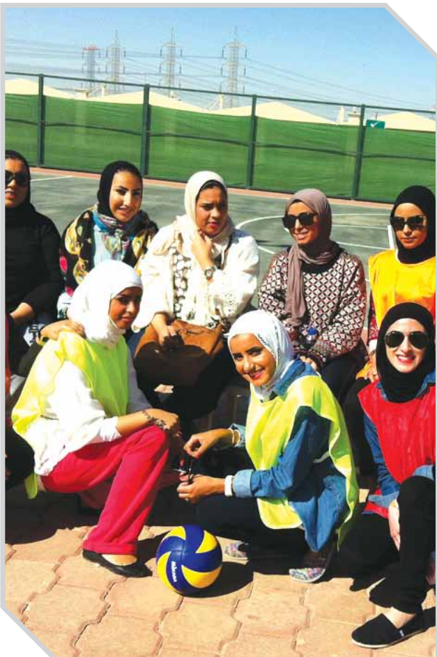
فريق كرة الطائرة من الطالبات