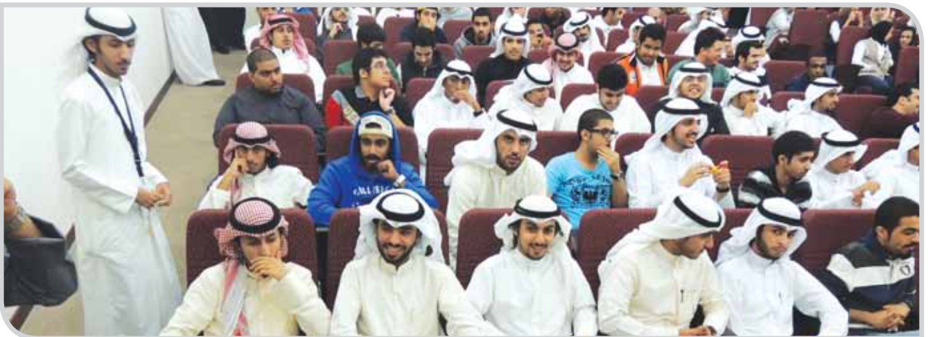
جانب من الحضور في إحدى الندوات