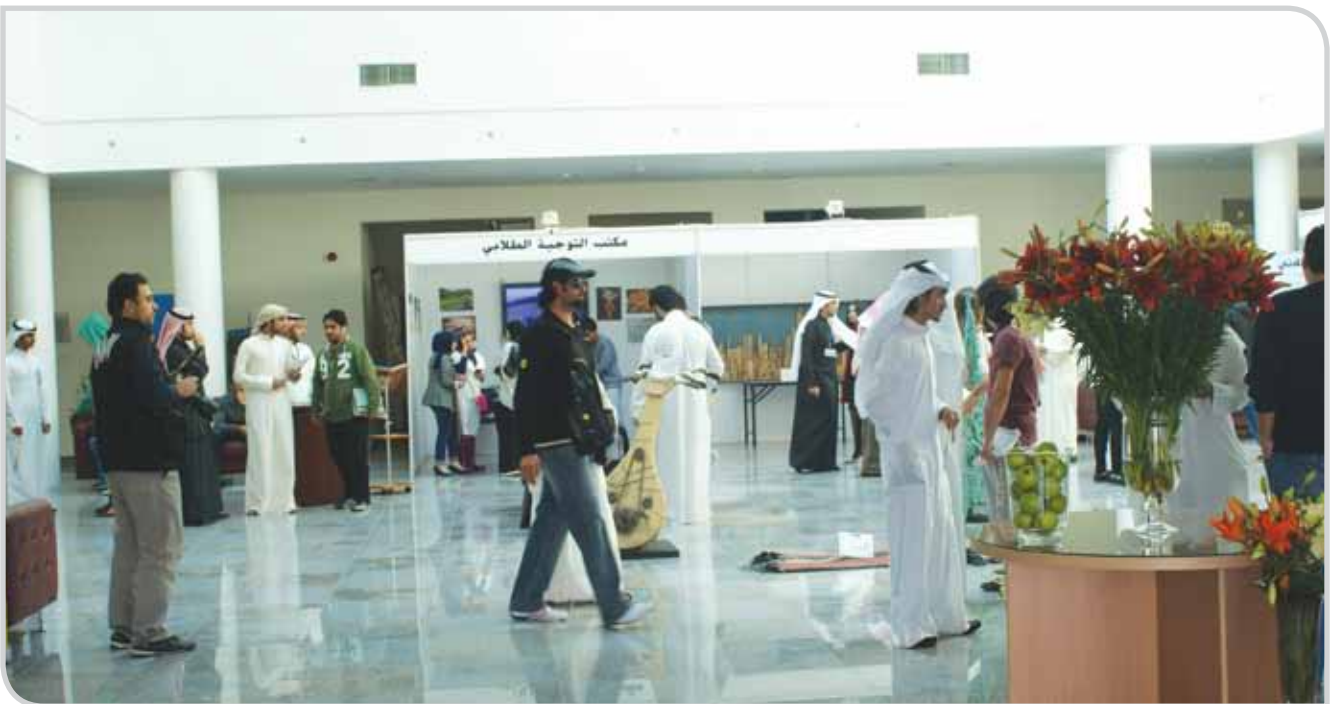
معرض بيئتي مسئوليتي