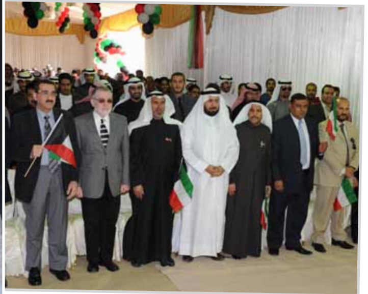
احتفالات العيد الوطني