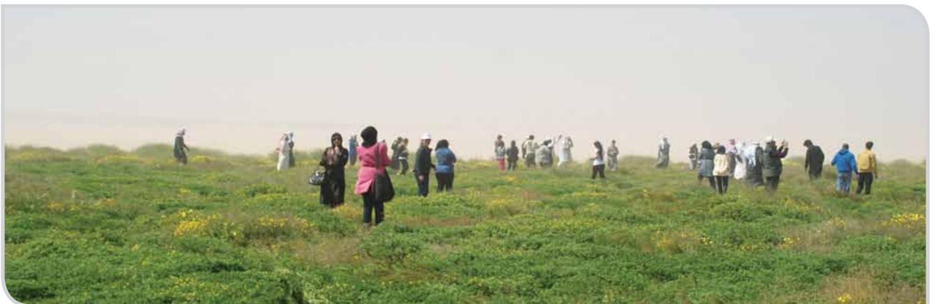
محمية الشيخ صباح الأحمد الطبيعية