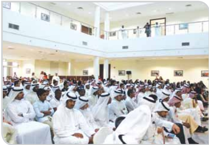
اجتماع الجمعية العمومية