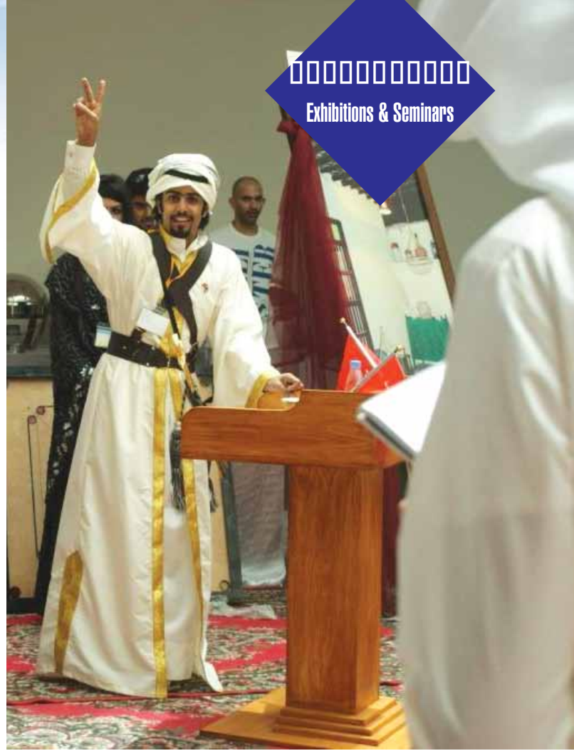
مشاركة الطلبة في اليوم التراثي