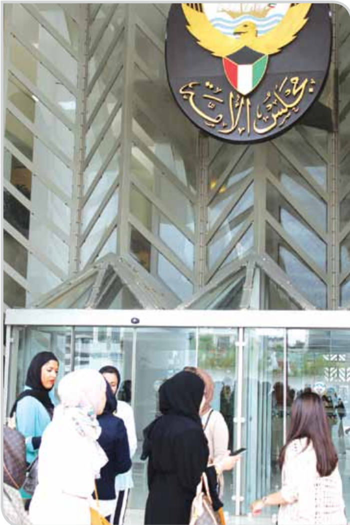
أمام مبنى مجلس الأمة