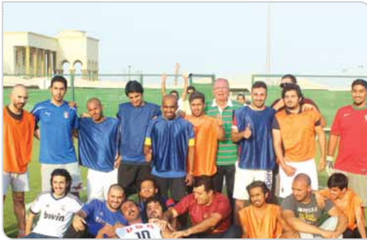
في اليوم الرياضي الأول