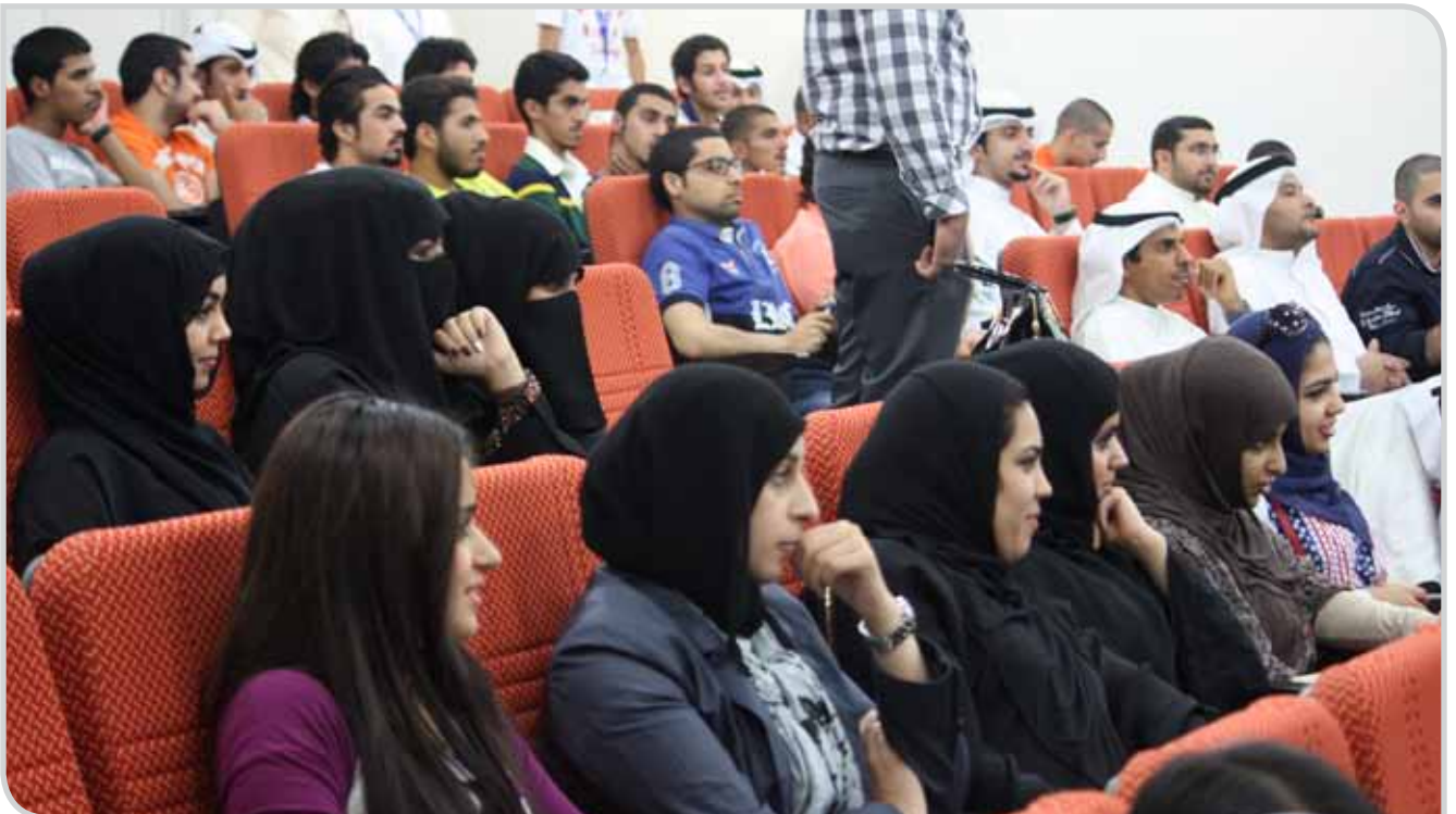
جانب من الحضور في ندوة الجامعات الزميلة