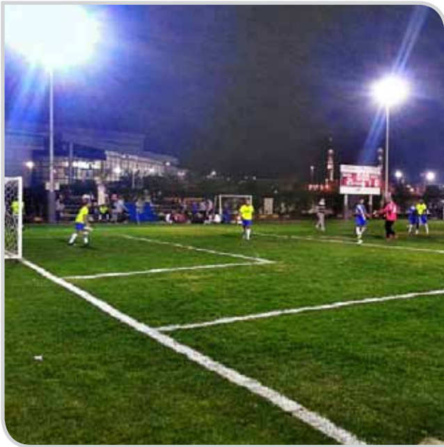
بطولة الجامعات الخاصة التي شارك فيها منتخب الكلية

كانت مشاركتي في البرامج الرياضية التي تنظمها الكلية من إيماني بأهميتها لبناء الجسم السليم. لقد غرس في نفسي حب التنافس بين الأصحاب، إنها حقاً تجربة جميلة والأجمل منها تعرفي على مجموعة طيبة من الأخوان. فالرياضة تربية للنفوس قبل أن تكون إحرازاً للكؤوس. ونأمل بإذن الله في المشاركات القادمة بتحقيق مراكز متقدمة.