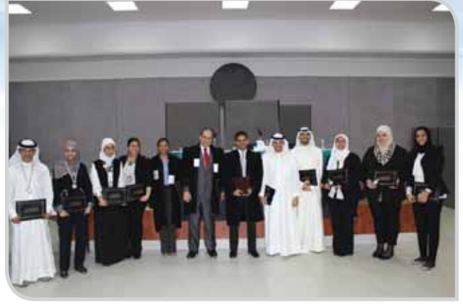
صورة جماعية تضم فريق الكلية وفريق جامعة الكويت

The Philip C Jessup competition is a competition for law student around the world, and I had the privilege this year to be a part of it. The Jessup 2013 was a remarkable experience. I met people from all around the world, competed with some of the best law students, and had a chance to experience what it actually means to be a law student. Jessup was a phenomenal experience from head to toe. Beginning with learning more about international and environmental law, to researching everything from small countries to wars and invasions and reading so many cases I wouldn't have done if I wasn't a part of it. Learning about how every law that is used today was made and the story behind it and learning much more things than sitting in a classroom would ever do. Jessup is the best competition a law student could ever be a part up as it provides useful information, a new way of thinking and friends from around the world.