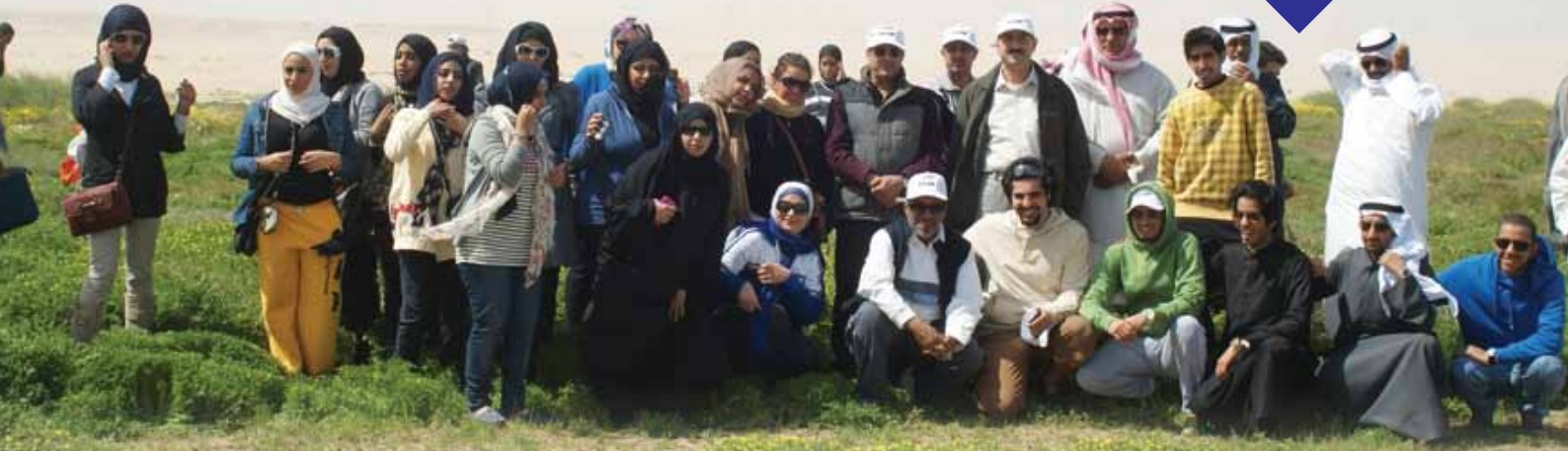
في محمية الشيخ صباح الأحمد الطبيعية

نظم قسم الأنشطة الطلابية العديد من الرحلات والزيارات الميدانية بهدف تعزيز الجانب العملي التطبيقي بما يخدم الدراسة النظرية الأكاديمية التي يتلقاها الطلبة داخل القاعات الدراسية، هذا بالإضافة إلى الرحلات الترفيهية التي لا تخلو من الفائدة وتنمية المهارات.