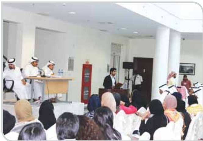
جانب من اجتماع الجمعية العمومية في اكتوبر 2012