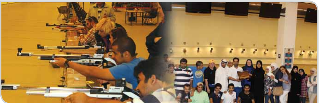
الطلبة يتدربون على التصويب نحو الهدف