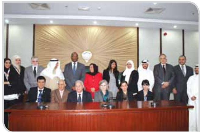
في المحكمة السورية