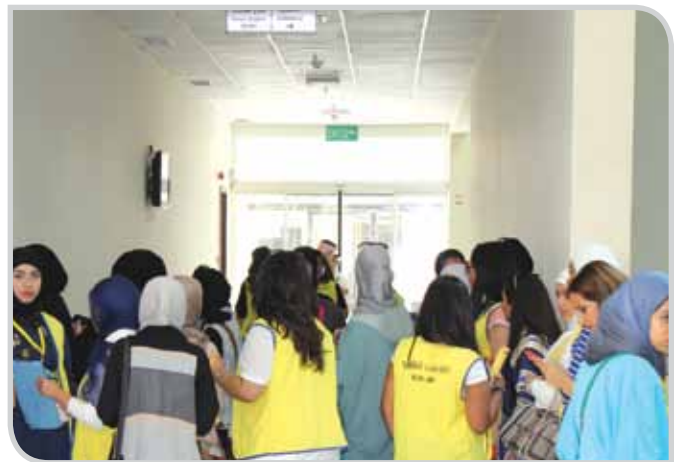
مشاركة فعالة من الطالبات في العملية الانتخابية