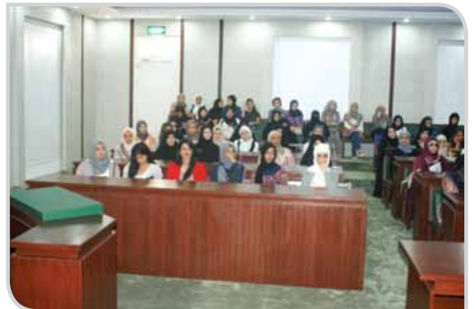
في المحكمة السورية