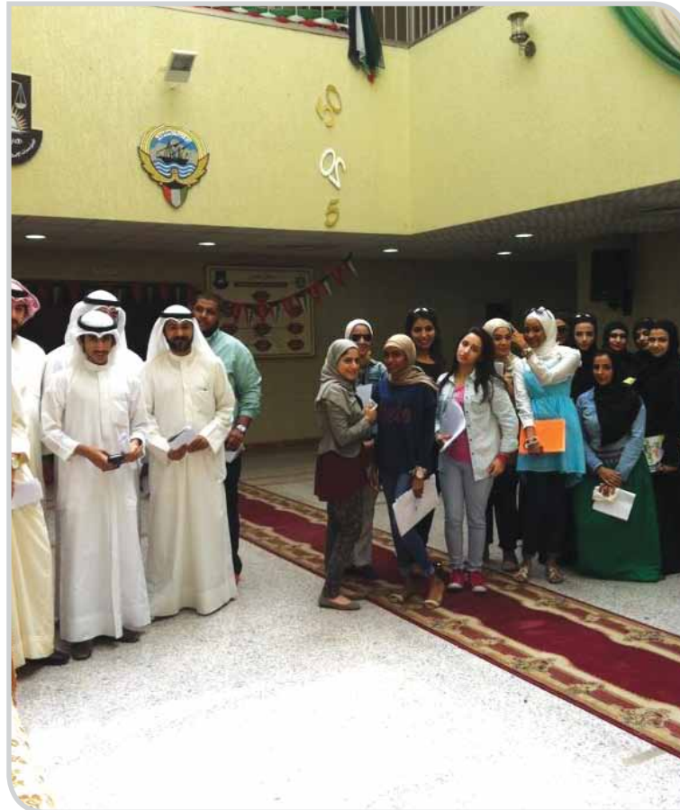
زيارة السجن المركزي