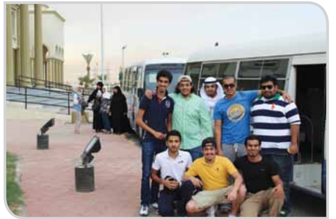
الاستعداد للانطلاق الى مجمع الشيخ صباح الأحمد لميادين الرماية