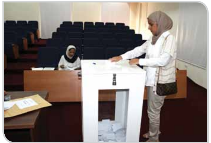
طالبة تدلي بصوتها