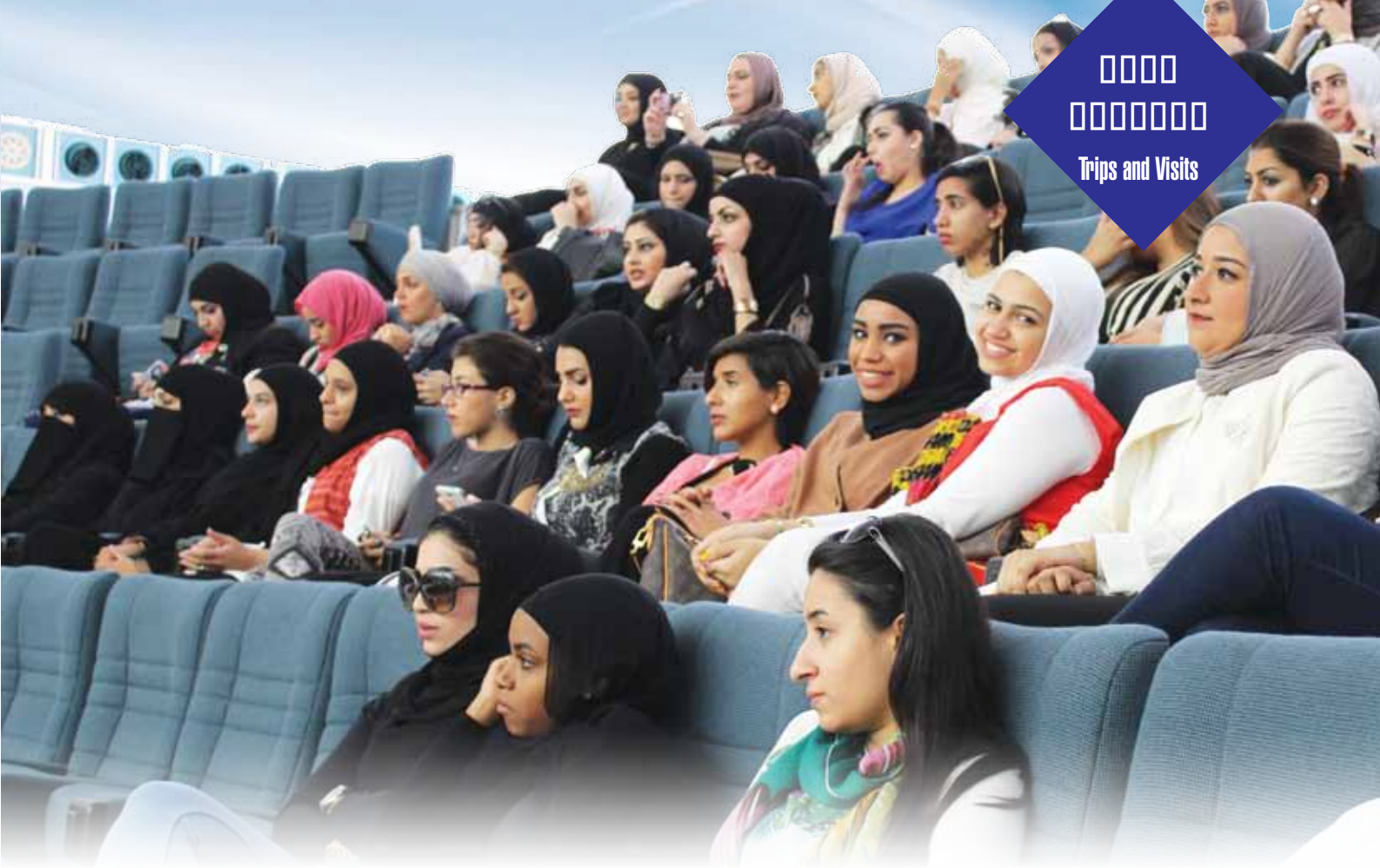
الطالبات يتابعن الجلسة في قاعة عبدالله السالم