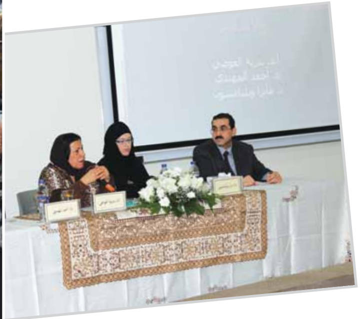
ندوة حقوق الإنسان بين المواثيق الدولية والإسلام ديسمبر 2012