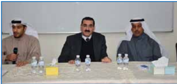
واللقاء التوجيهي لطلبة الماجستير LL.M Freshmen's Orientation Day