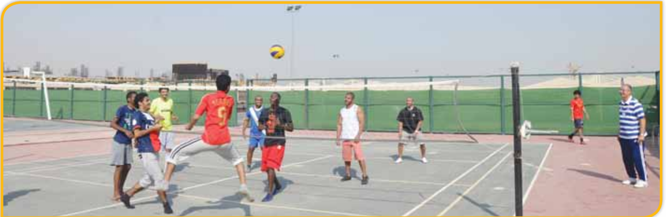
مباراة في كرة الطائرة