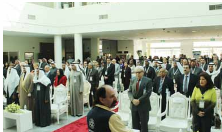
الوقوف تحية للنشيد الوطني