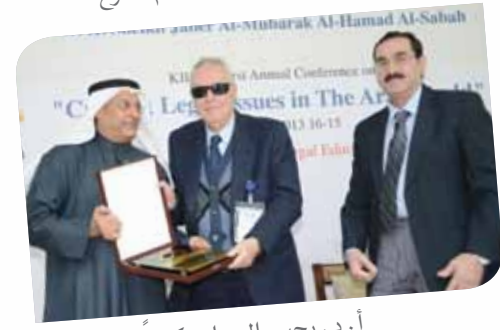
أ. د. يحيى الجمل مكرماً