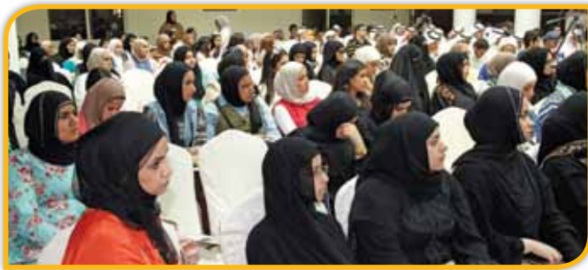
طالبات يتابعن التعليمات والإرشادات

يمثل اللقاء التنويري للطلبة المستجدين الذي ينظمه قسم القبول مع بداية كل فصل دراسي، نقطة الانطلاق لهؤلاء الطلبة لبدءوا مرحلة جديدة من أعمارهم، في رحاب الكلية، مع ما يعنيه ذلك من اعتماد على النفس، وتحل بالمسؤولية، والاستعداد لاختيار طريق المستقبل المهني، ومع بداية العام الجامعي 2013 - 2014، تم يوم الخميس الموافق 5 سبتمبر 2013 اللقاء التنويري الذي حضره رئيس مجلس الأمناء د. بدر الخليفة، ورئيس وعميد الكلية أ. د. محمد المقاطع، والعميد المساعد للشؤون الطلابية د. صالح العتيبي، ورئيسة قسم القبول والشؤون الطلابية الأستاذة/ فوزية الشهاب، ومسؤولة الأنشطة الطلابية الأستاذة/ سلوى العجيري، الذين تحدث كل منهم من خلال موقعه ومسؤوليته عن الجوانب الأساسية التي يجب أن يعرفها المستجدون في مستهل حياتهم الجامعية من حقوق وواجبات، والنظم واللوائح المتبعة لضمان حسن سير العملية التعليمية، وتعريف بالمنهاج الدراسي المتبعة، إضافة إلى جولة على مرافق الكلية للتعرف على الإمكانيات التي وضعتها الكلية في تصرف طلبتها، لتأهيلهم إلى أرقى المستويات التعليمية لدارسي القانون نظريا وتطبيقيا.