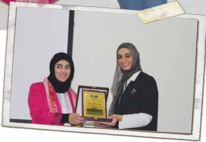
تكريم احدى المشاركات