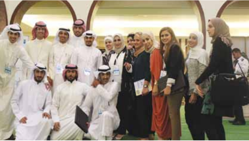
فريق دوري المناظرات 2014