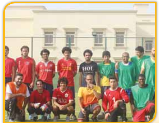
فريق كرة القدم