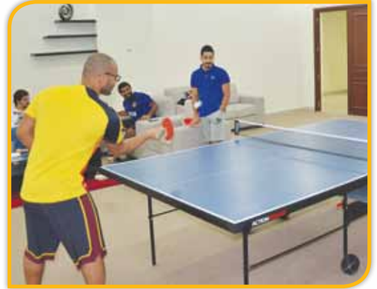
منافسات على تنس الطاولة