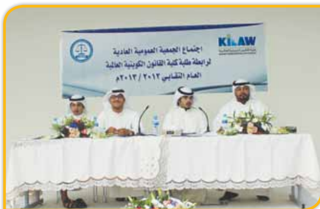
أعضاء الرابطة السابقون