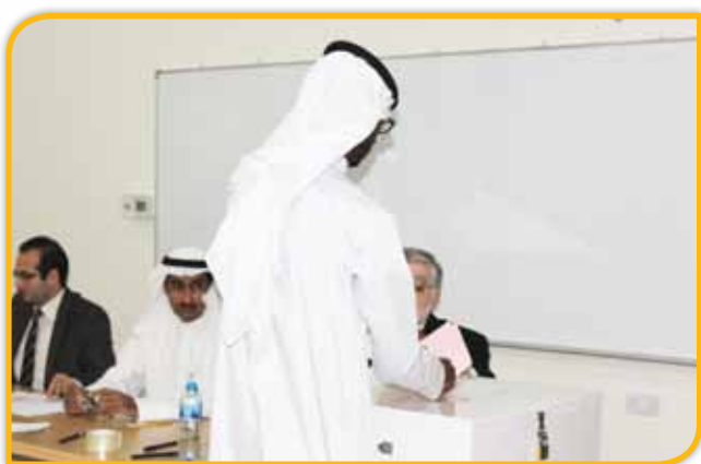
طالب يدلي بصوته