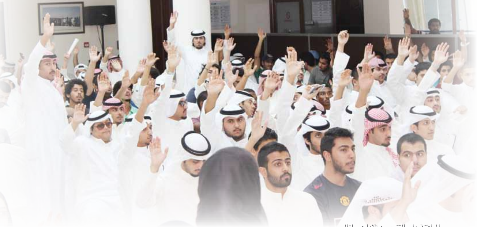
الموافقة على التقريرين الإداري والمالي