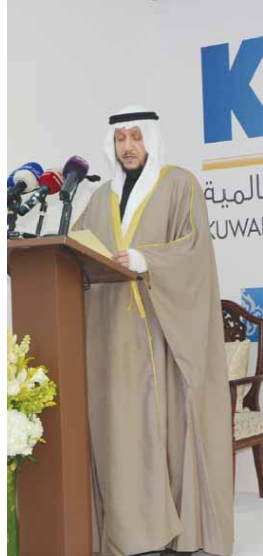
معالي وزير العدل ووزير الأوقاف والشؤون الإسلامية السابقة شريفة المعوشرجي