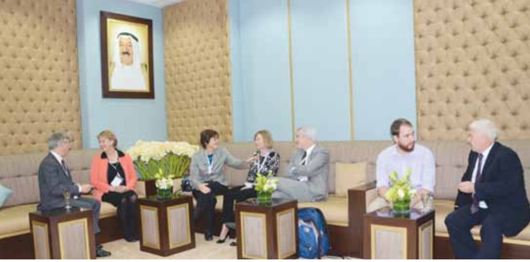
أعضاء المجلس الاستشاري شاركوا في المؤتمر