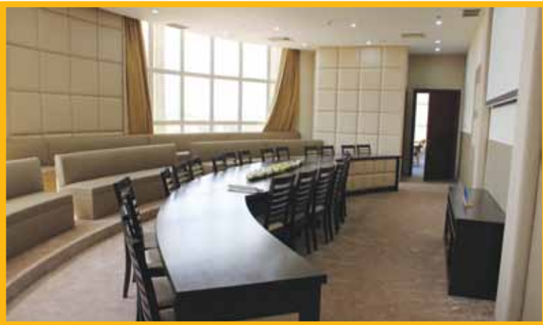
قاعة متعددة الاستخدامات

روعي عند تصميم مبنى كلية القانون الكويتية في منطقة الدوحة أن يستوعب كل ما يمكن أن تحتاج إليه الجامعات العصرية من مرافق ومنشآت قادرة على تلبية احتياجات الطلبة والأساتذة والموظفين في عملهم اليومي، مما يوفر عليهم الوقت والجهد حتى يؤدي كل واحد منهم واجبه ومسؤولياته على الوجه الأكمل.