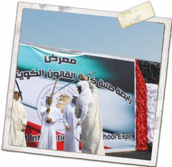
احتفالية العيد الوطني