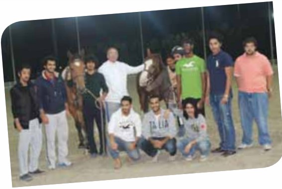
لقطة للذكرى بعد انتهاء التدريب