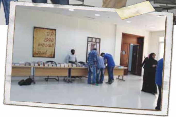
معرض الكتاب الإنجليزي