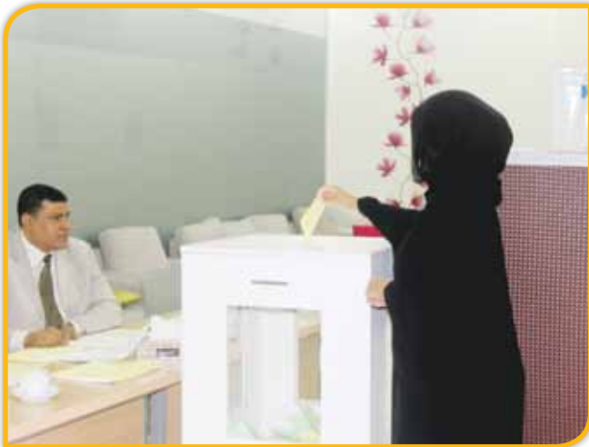
طالبة تدلي بصوتها

في أداء مسؤولياتهم تجاه زملائهم الطلبة، والتنسيق مع إدارة الكلية والعميد المساعد لشؤون الطلبة، لما فيه خير ومصالحة العملية التعليمية في الكلية، وفقاً للأسس والقواعد والنظم واللوائح، بالإضافة إلى تنظيم العديد من الأنشطة والفعاليات في مختلف المناسبات التي شارك فيها الطلبة بفعالية وحماس.