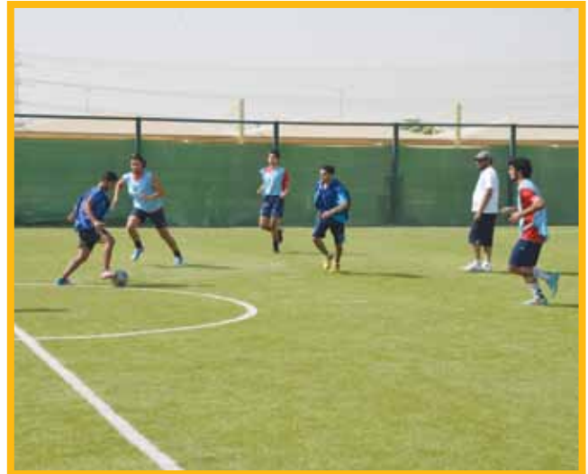
ملعب كرة القدم

فمن المكتبة التي تتسع لحوالي 1000 طالب وطالبة، إلى الفصول الذكية، إلى مختبرات الكومبيوتر التي يصل عددها إلى ثمانية مختبرات، إلى المحكمة الصورية التي تحاكي في تصميمها المجلس التأسيسي الذي شهد ميلاد دستور دولة الكويت، إلى استراحة الطلاب واستراحة الطالبات اللتين يمضون فيهما لحظات للتلاقي والتعارف ومد جسور علاقات الزمالة والصدقة، إلى ملاعب كرة القدم وكرة الطاولة حيث ممارسة الهوايات الرياضية والمنافسة، إلى القاعات المتعددة الأغراض التي تستقبل اللقاءات والندوات والمحاضرات التي يتم تنظيمها على مدار العام في الكلية، إضافة إلى العيادة الطبية، ومستلزمات القرطاسية والكافتيريات وإلى ما هنالك من مراقق وضعت كلها تحت تصرف طلبتنا لتكون عنصراً مساعداً لهم في التفرغ للتحصيل العلمي.