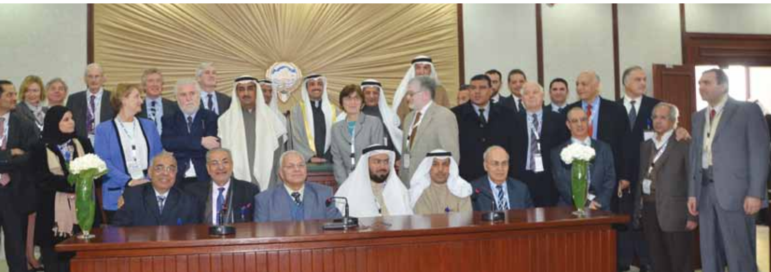
لقطة تذكارية مع أعضاء هيئة التدريس والمجلس الإستشاري