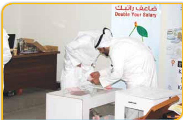
التدقيق على الأسماء