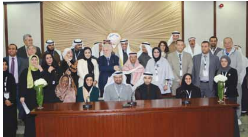
لقطة تذكارية مع الموظفين