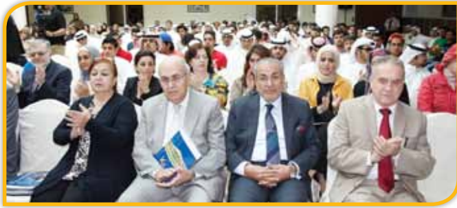
عدد من أعضاء هيئة التدريس يتقدمون الحضور